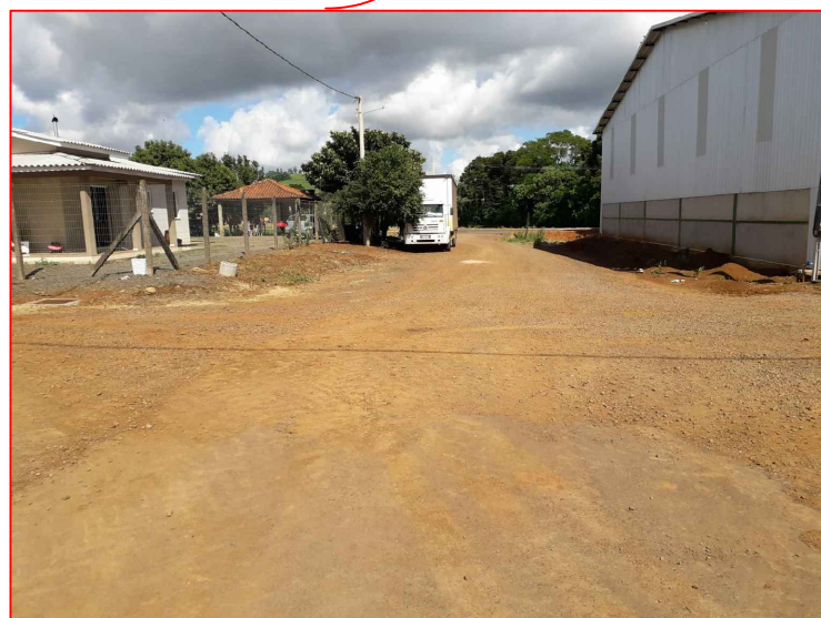
Foto Rua Antônio Nogarà