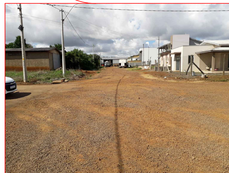
Foto Rua Natal Zappani - 02