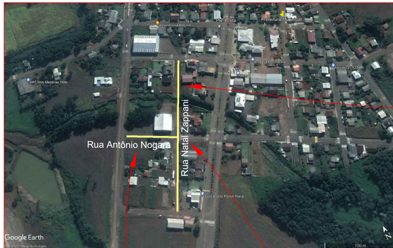
PLANTA DE SITUAÇÃO